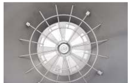
Mischer mit Magneten im Materialtrichter