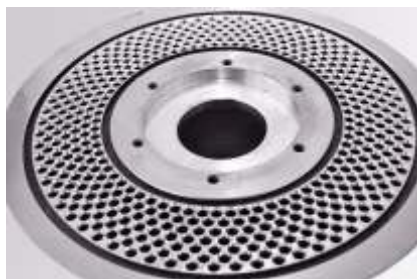
Hochwertige gehärtete Flachmatrize