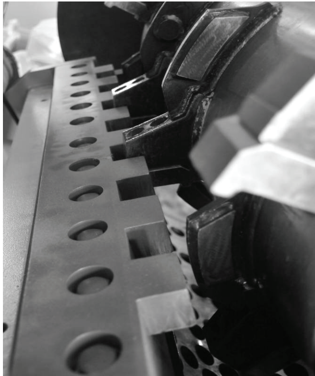
Abbildung4 : Rotor- und Statorwerkzeuge

Die extrem verschleißgeschützten Bereiche der Hammermühle: