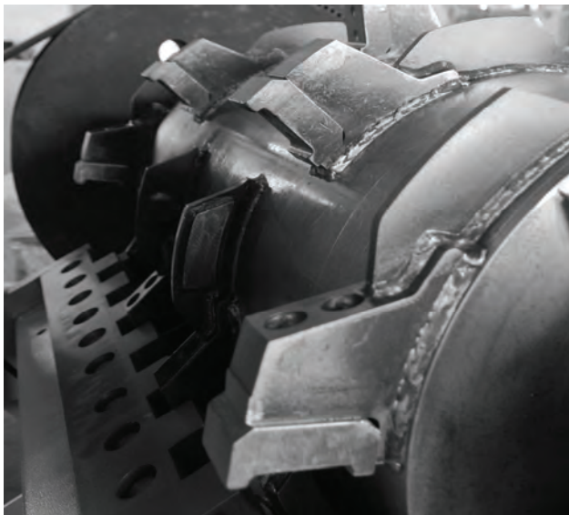
Abbildung 1: Rotor