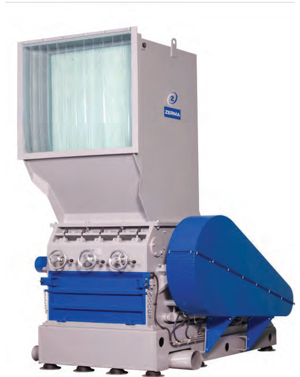
Abbildung 3: ZHM 800/1200